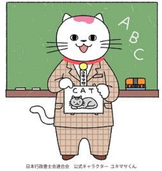
日本行政書士会連合会 公式キャラクター ユキマザクン